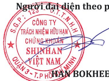
HAN BOKHEE Chủ tịch Hội đồng thành viên